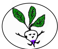
CLEOPATRA, la rapa