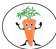
CARLOTTA, la carota